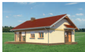
Elewacja bok 2