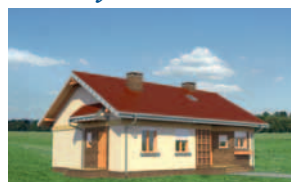
Elewacja bok 1