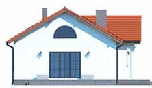
Elewacja bok 1