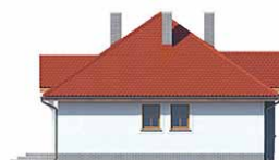
Elewacja bok 1