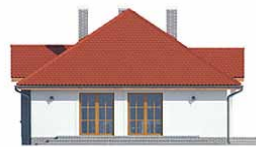
Elewacja bok 2