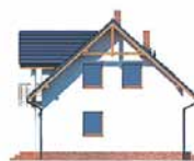
Elewacja bok 2