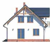
Elewacja bok 1