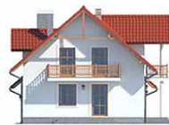
Elewacja bok 2