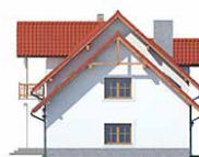
Elewacja bok 1